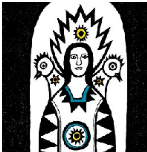
Livro: O Auto da Compadecida

O longa conta a história do xerife aposentado George Blackledge e sua esposa Margaret, que, após perderem o seu filho James, deixam o seu rancho para resgatar o seu neto de uma família perigosa comandada pela matriarca, Blanche Weboy. Ao descobrirem que os estranhos não têm a intenção de libertar o pequeno Jimmy, o casal decide lutar para salvar a criança. O filme está disponível na Netflix.