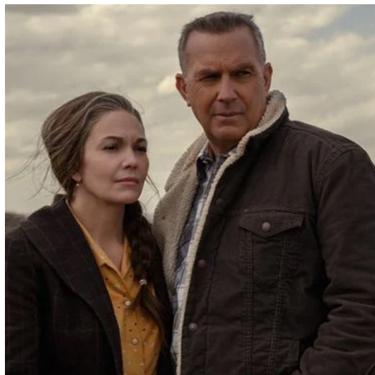
Filme: Deixe-o Partir

O longa conta a história do xerife aposentado George Blackledge e sua esposa Margaret, que, após perderem o seu filho James, deixam o seu rancho para resgatar o seu neto de uma família perigosa comandada pela matriarca, Blanche Weboy. Ao descobrirem que os estranhos não têm a intenção de libertar o pequeno Jimmy, o casal decide lutar para salvar a criança. O filme está disponível na Netflix.