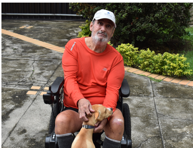
Brincando com sua cachorrinha de estimação