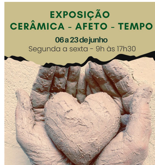
Exposição: Cerâmica, Afeto, Tempo

O Auto da Compadecida, obra do autor Ariano Suassuna, é um drama do Nordeste brasileiro, que mescla elementos como literatura de cordel, a comédia, traços do barroco católico brasileiro e, ainda, cultura popular e tradições religiosas. Na trama, os amigos João Grilo e Chicó buscam sobreviver em um ambiente miserável usando de sua esperteza para resolver os problemas e ganhar o pão de cada dia.