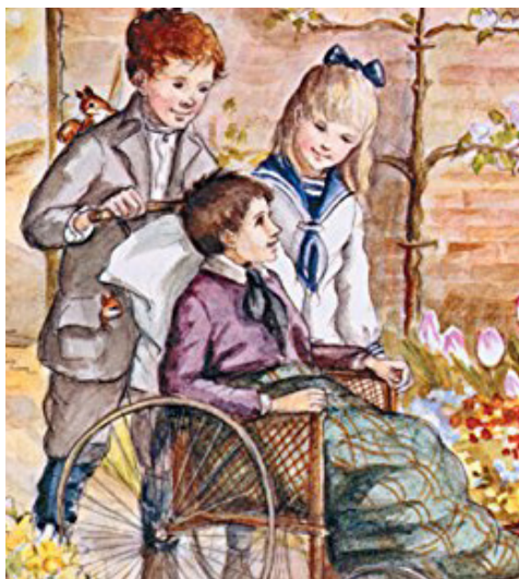
Livro: O Jardim Secreto