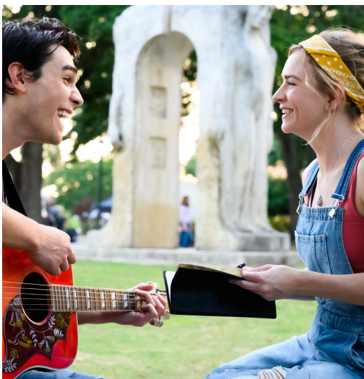
Filme: Enquanto Estivermos Juntos